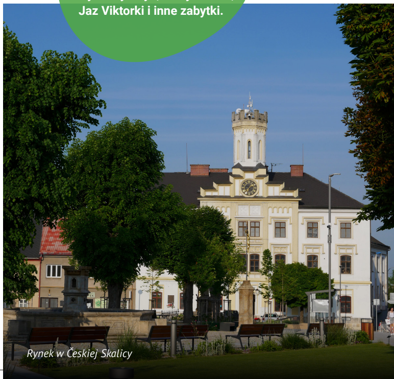
Rynek w Českiej Skalicy

Na stosunkowo niewielkim obszarze Doliny Babuni znajduje się Pałac Ratibořice, zabytkowy młyn, Stary bielnik, Jaz Viktorki i inne zabytki.