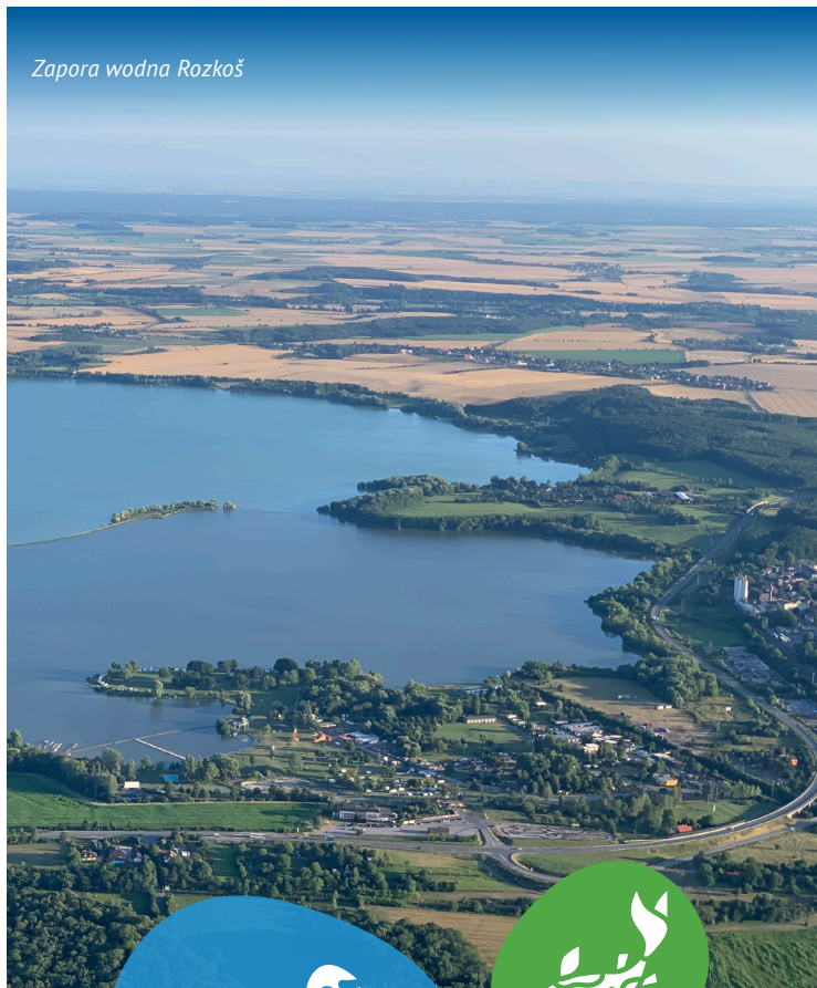
Zapora wodna Rozkoš