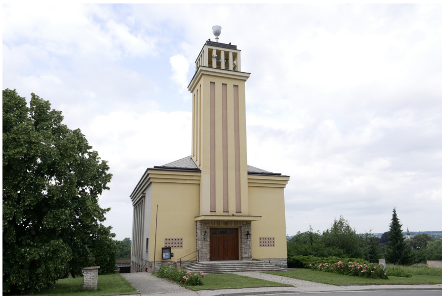
Sbor Páně Cirkve československé husitské Zbór Czechosłowackiego Kościoła Braterskiego