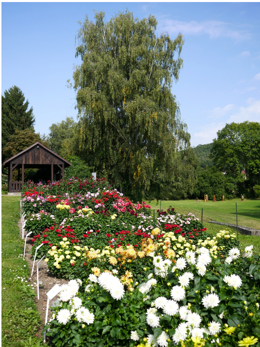
Jiřinkový záhon pod Muzeem Boženy Němcové Rabatka z daliami obok Muzeum Boženy Němcovej