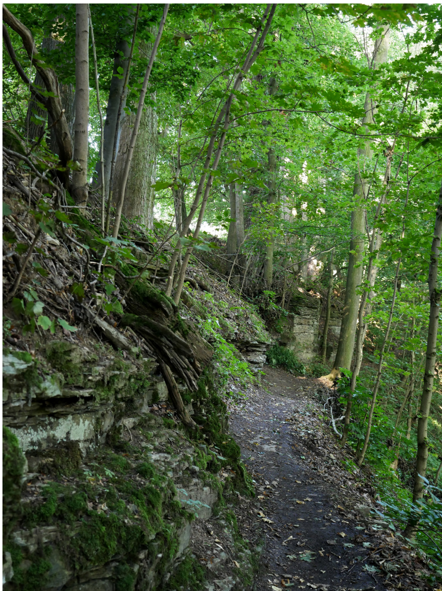
Cesta k Rýzmburskému altánu Droga w stronę altany rýzmburskiej