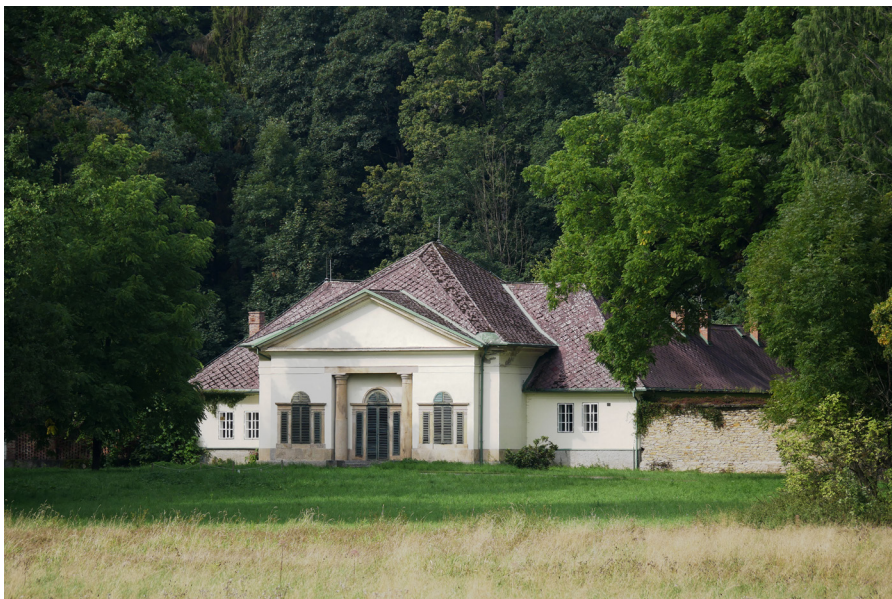
Lovecký pavilon Pałac myśliwski