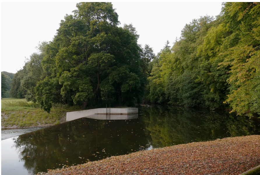
Řeka Úpa Rzeka Úpa