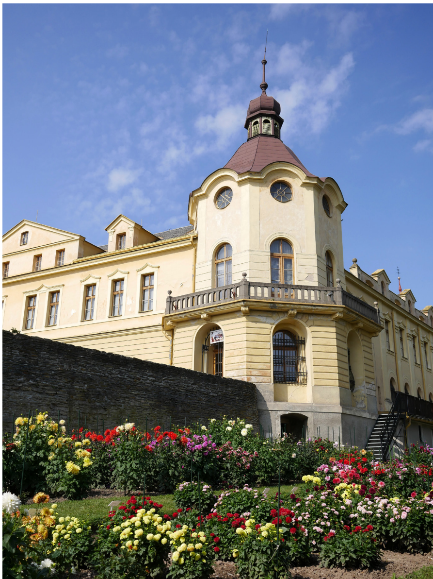
Muzeum Boženy Němcové s jirinkami Muzeum Boženy Němcovej z daliami