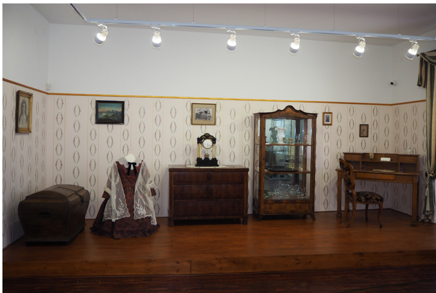
Muzeum Boženy Němcové – interiér Muzeum Boženy Němcovej – wnątrze