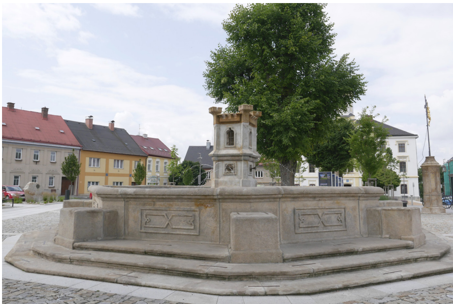
Kamenná kašna na Husově náměstí Kamienna fontanna na Placu Husa