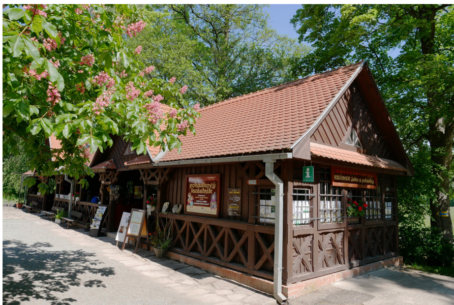
Pohádkový kuželník Bajkova kregielnia