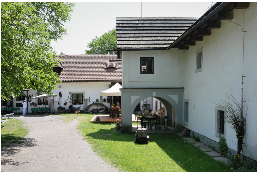
Rudrův mlýn Mlyn Rudra