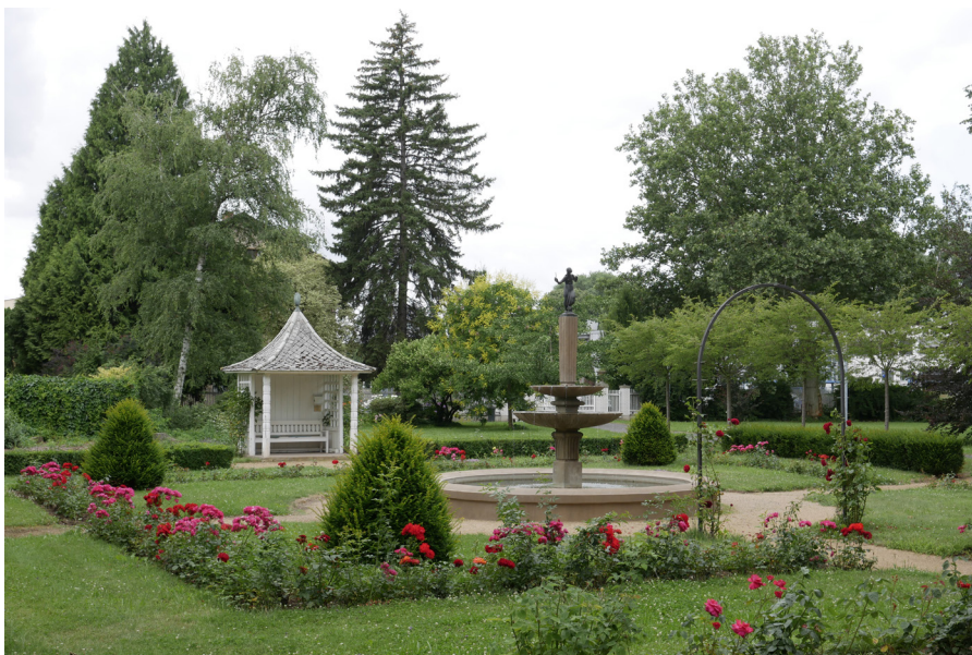
Zahrada Vily Čerych Ogrody willi Čerych