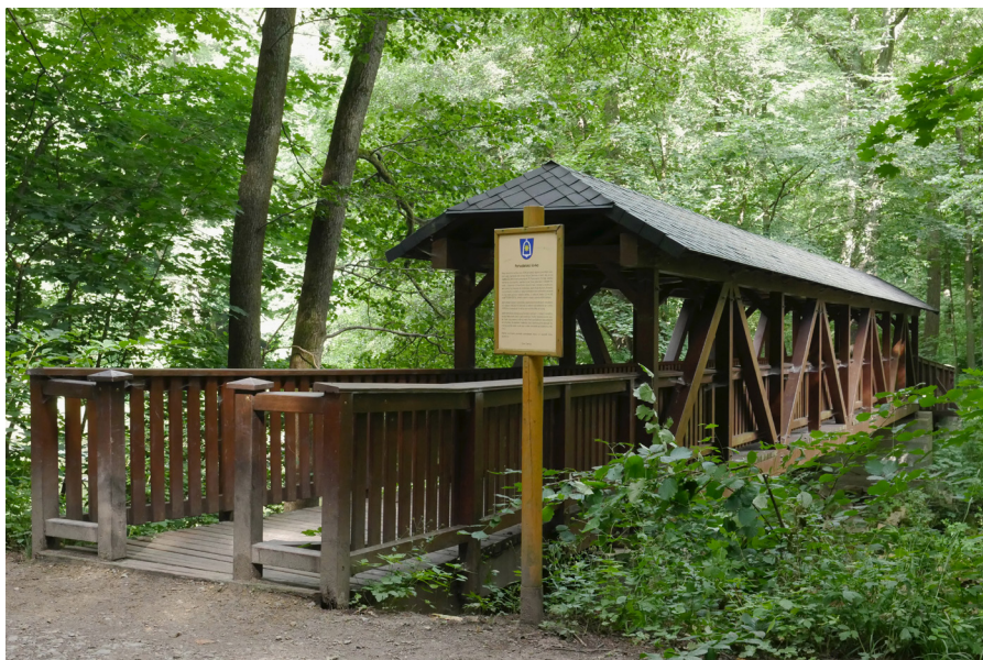
Lávka Na Pohodlí Klادka Na Pohodlí