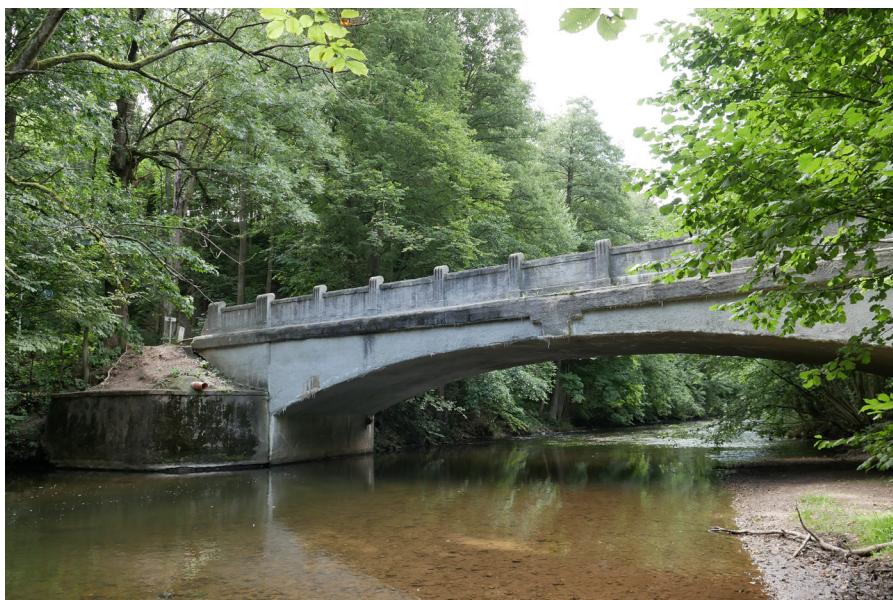
Vilémův most Most Viléma