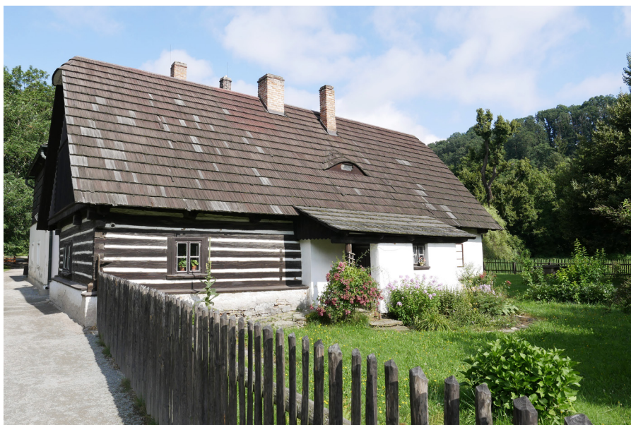
Staré bělidlo Stary bielnik