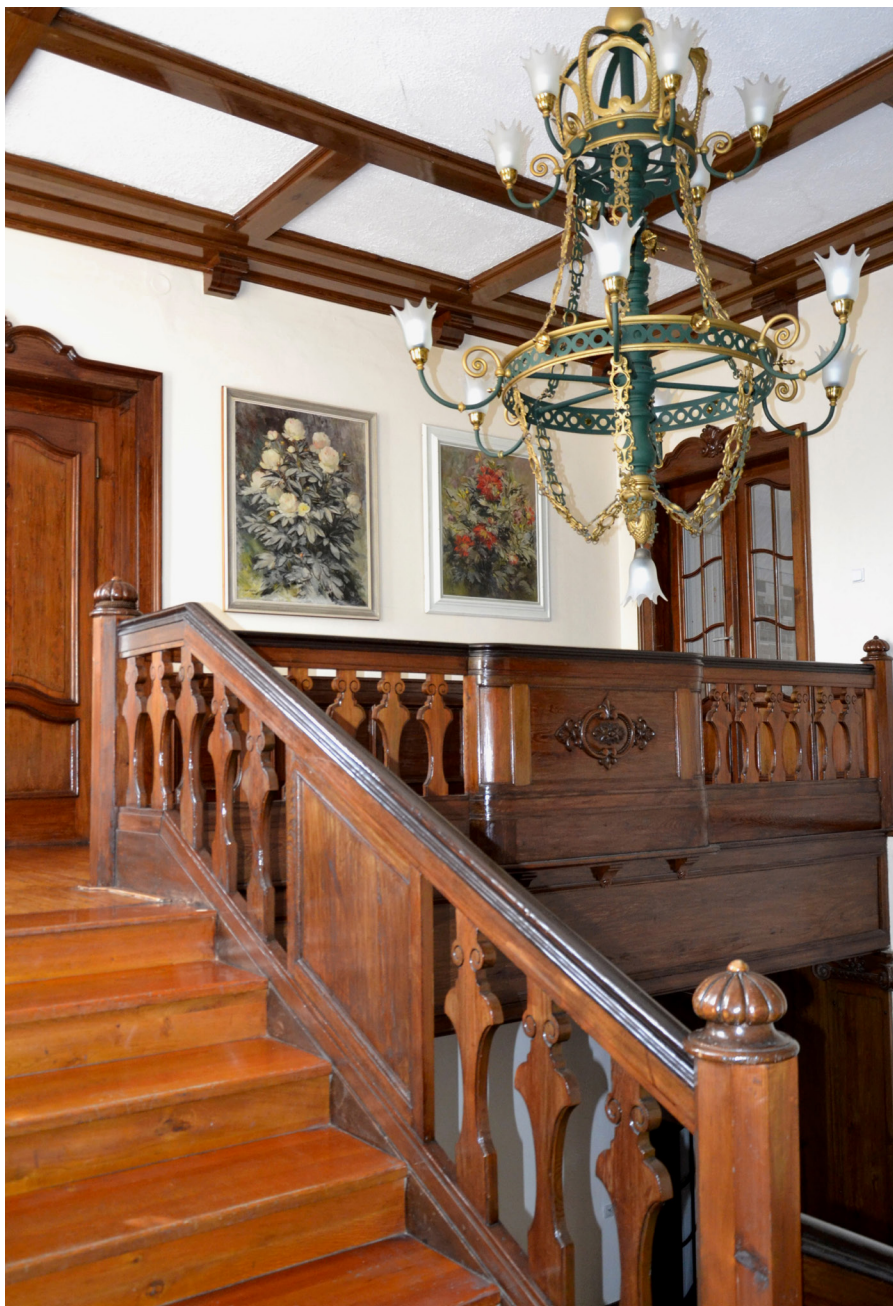
Muzeum Boženy Němcové – interiér Muzeum Boženy Němcovej – wnętrze