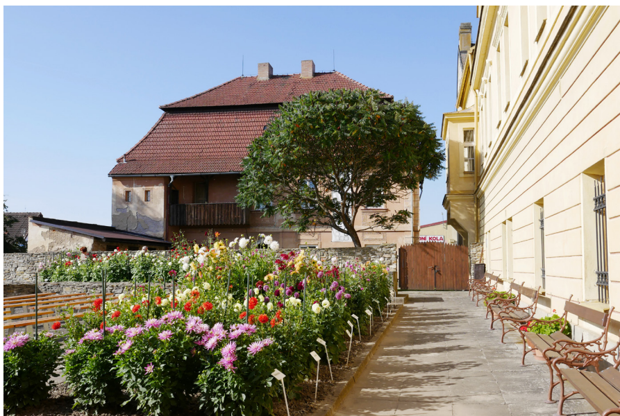
Muzeum Boženy Němcové s jirinkami a Galerii Luxfer Muzeum Boženy Němcovej z daliami i Galeriq Luxfer