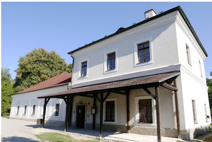
Vodní mandl Magiel wodny