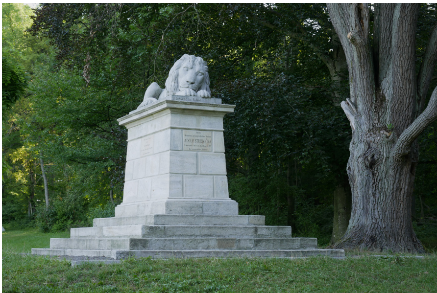
Spící lev na Dubně Śpiący lew w Dubnie