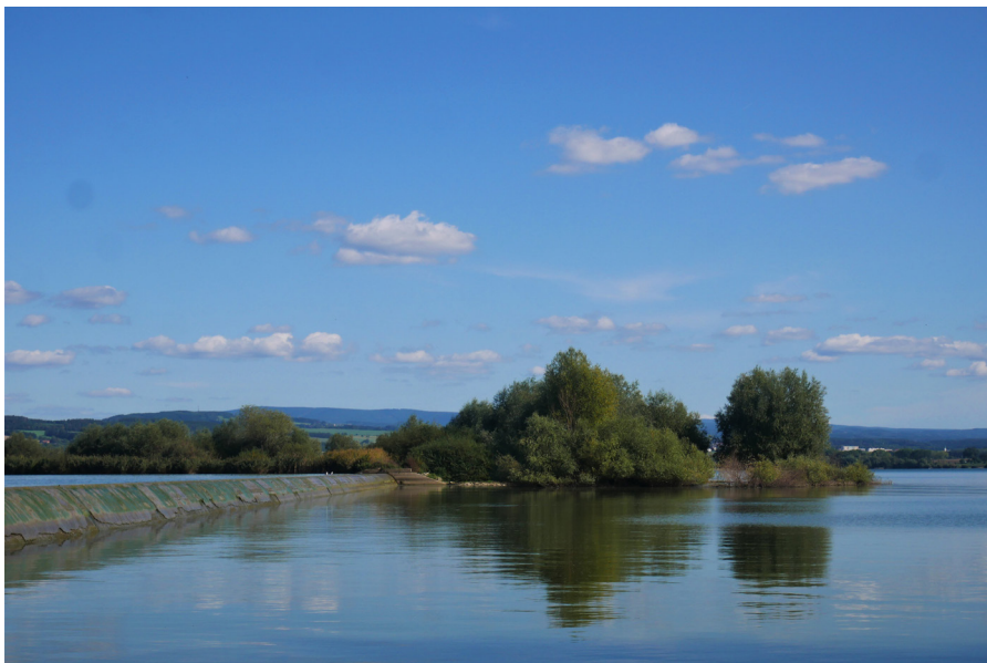
Spyta – pohled na dělicí hráz Spyta – widok na wał rozdzielający