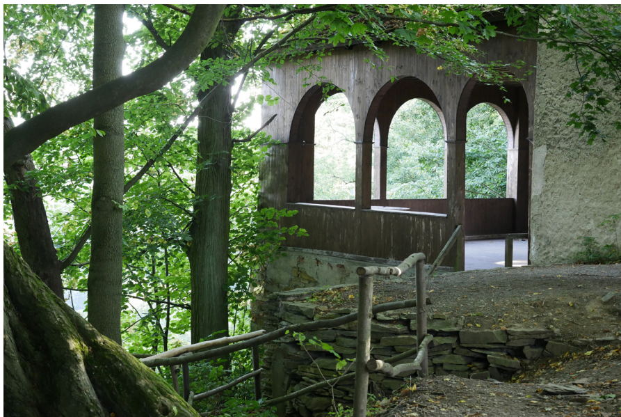
Rýzmburský altán Altana rýzmburska