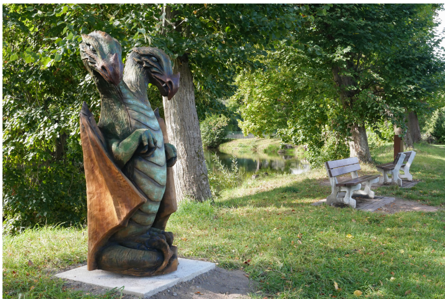
Dřevěná socha Drewniana figura