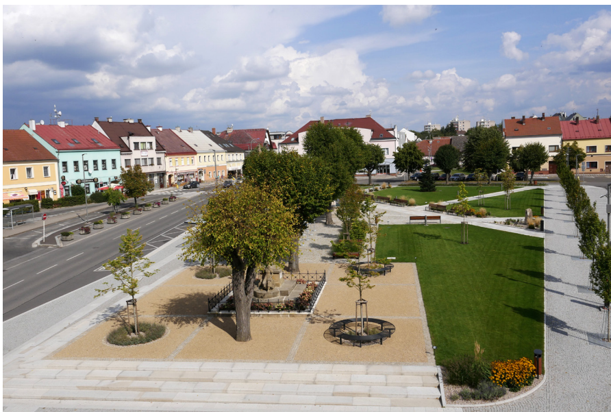
Husovo náměstí Plac Husa