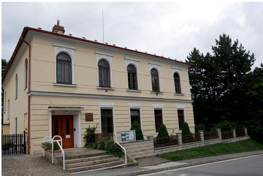
Sbor Cirkve bratrské Zbór Kościoła Braterskiego