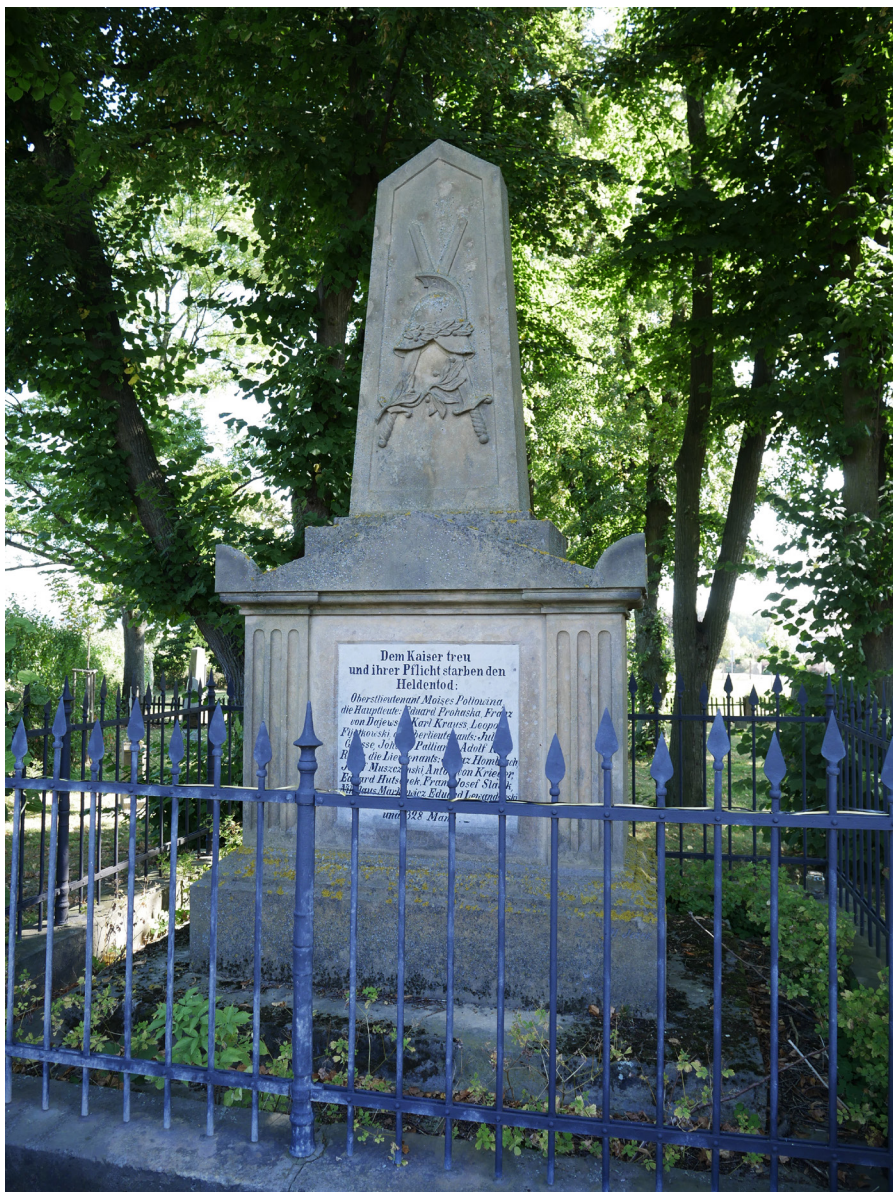
Pomník padlých za 1. světové války Pomník ku czci poległych w I wojnie światowej