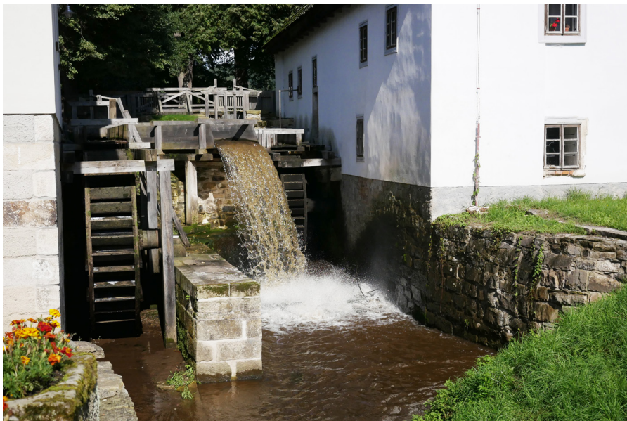
Mlýnské kolo Kolo mlyňské