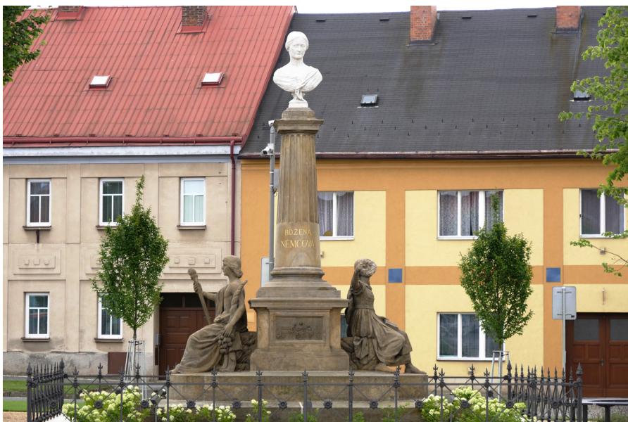
Pomník Boženy Němcové na Husově náměstí Pomnik Boženy Němcovej na Placu Husa