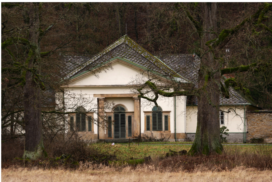
Lovecký pavilon Pałac myśliwski