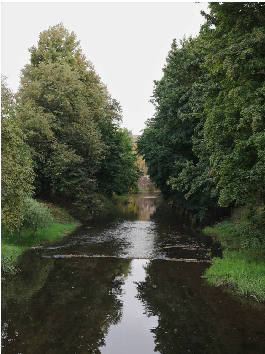
Řeka Úpa Rzeka Úpa