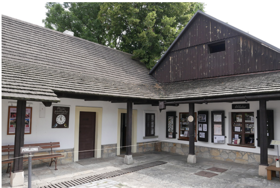
Barunčina škola – dvůr Szkola Barunki – podwórze przed szkołą