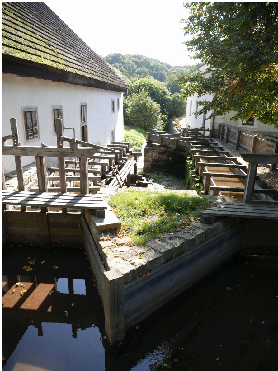
Mezi Vodním mandlem a Rudrovým mlýnem Między maglem wodnym a Młynem Rudra