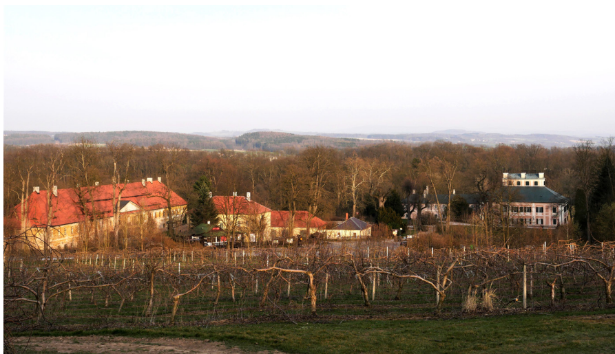
Babiččino údolí Dolina Babuni