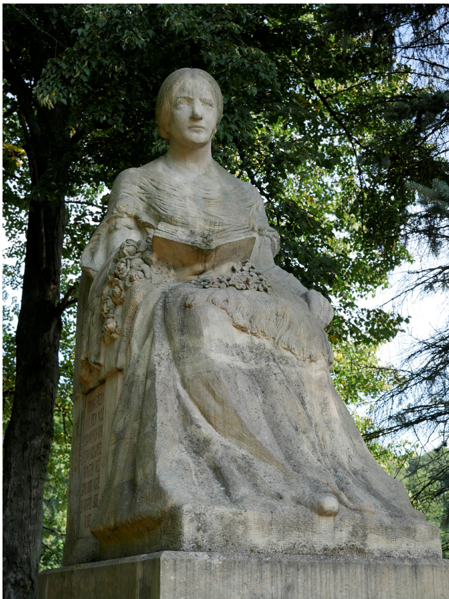
Socha Boženy Němcové ve Zlíči Pomnik Boženy Němcovej w miejscowości Zlīč