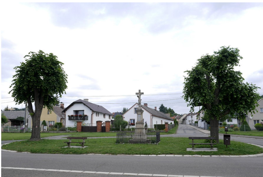
Náves v Malé Skalici Nawsie w Malej Skalicy