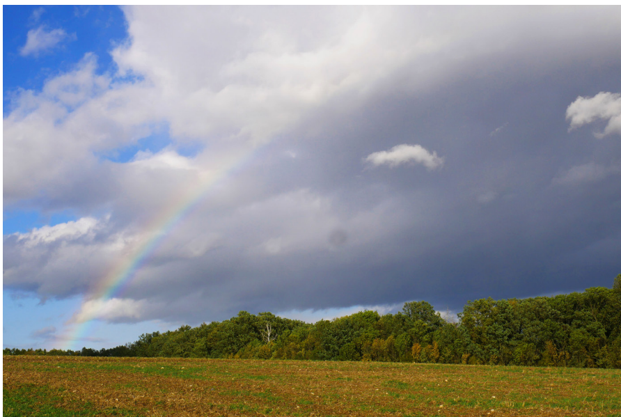
Ratibořické louky Ratibořické ląki