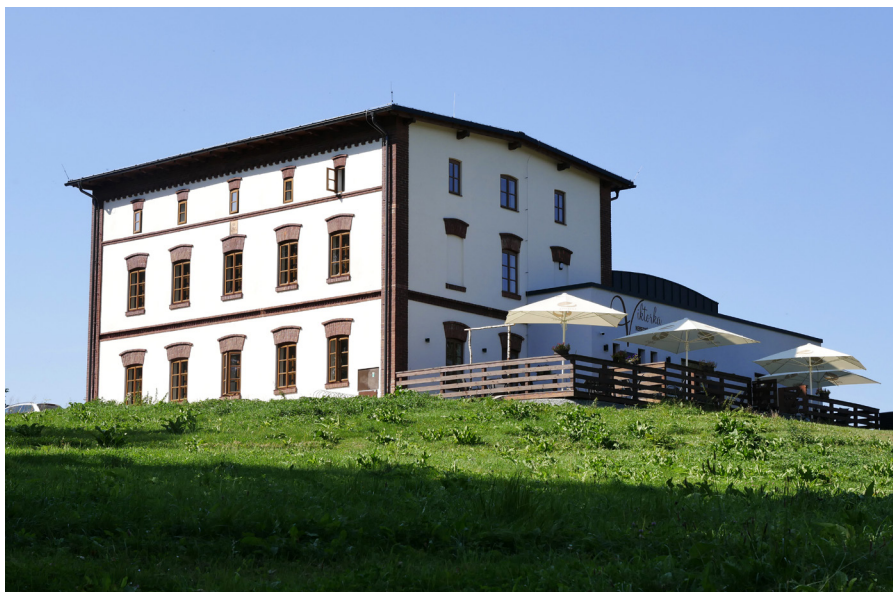
Herecké muzeum Viktorka Muzeum Aktorskie Viktorka