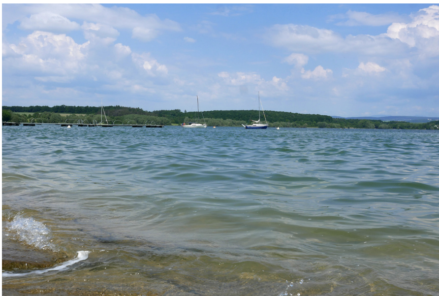
Vodní nádrž Rozkoš od Nového Města nad Metují Zbiornik wodny Rozkoš od strony Nowego Města nad Metują