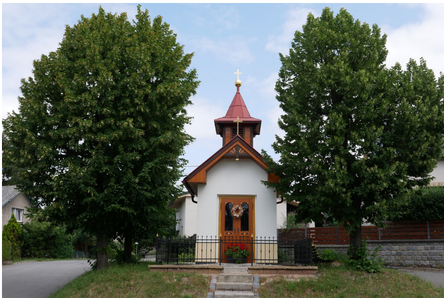
Kaplička v Zájездě Kapliczka w miejscowości Zájезд