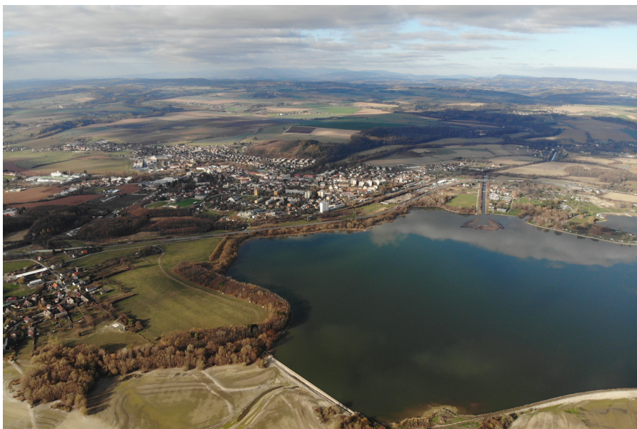
Východočeské moře – vodní nádrž Rozkoš Wschodnioczeskie morze – zbiornik wodny Rozkoš