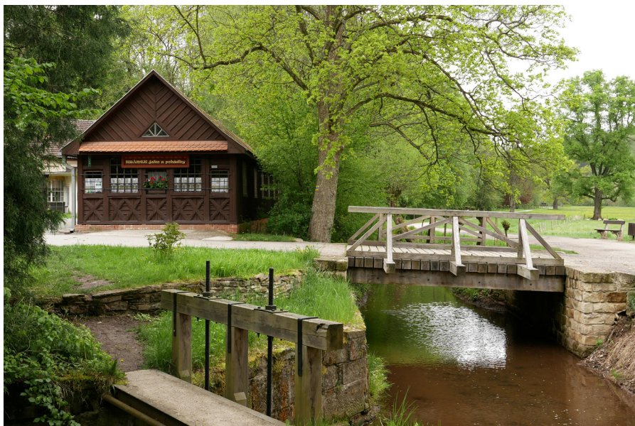
Pohádkový kuželník Bajkova kregielnia