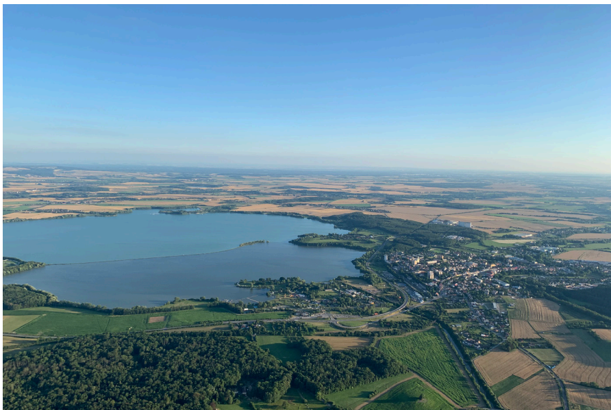
Letecký pohled na přehradu Rozkoš Widok z lotu ptaka na zaporę Rozkoš