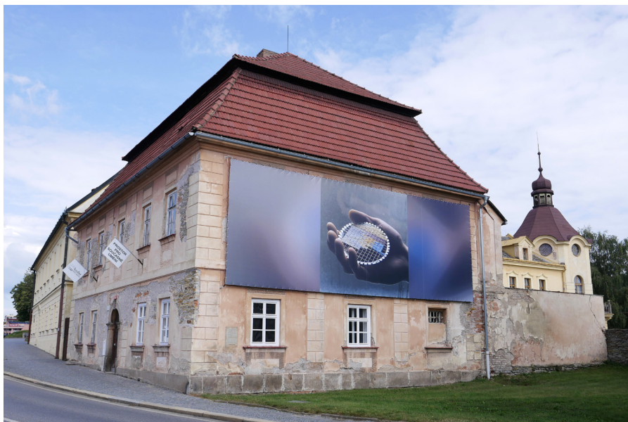
Galerie Luxfer Galeria Luxfer