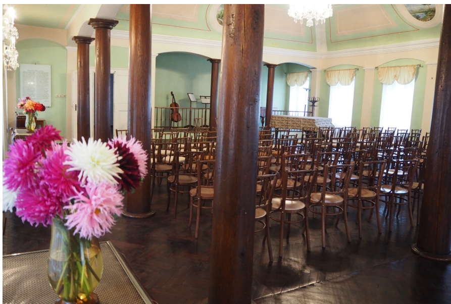
Muzeum Boženy Němcové – Jiřinkový sál Muzeum Boženy Němcovej – Sala Dalii