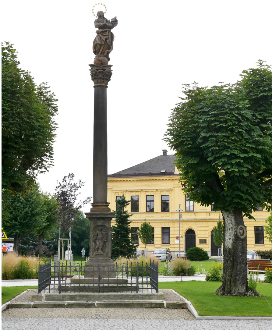
Sloup se sochou Panny Marie na Husově náměstí Kolumna z poságiem Matki Boskiej na Placu Husa