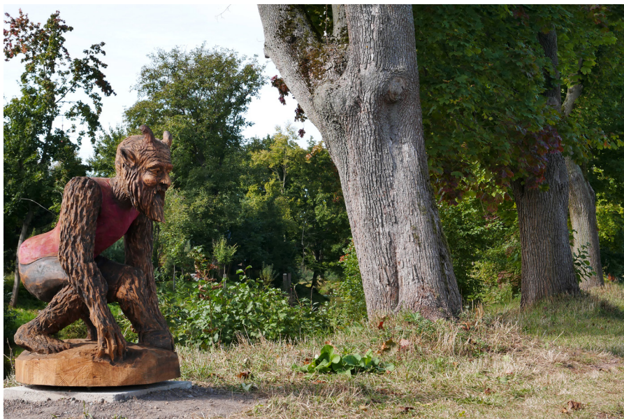
Dřevěná socha čerta Drewniana figura diabła