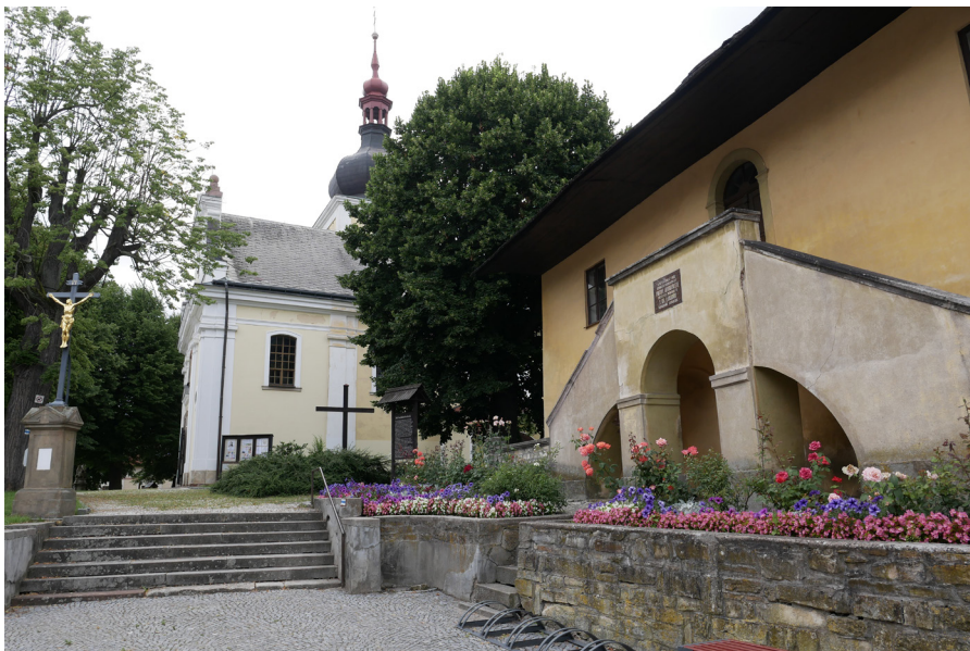
Stará fara s kostelom Nanebevzety Panny Marie Stara plebania oraz kościół Wniebowzięcia Najświętszej Marii Panny