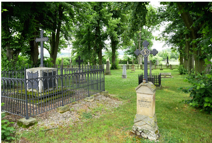
Vojenský hřbitov Cmentarz wojskowy