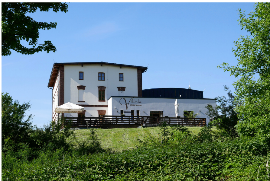
Herecké muzeum Viktorka Muzeum Aktorskie Viktorka