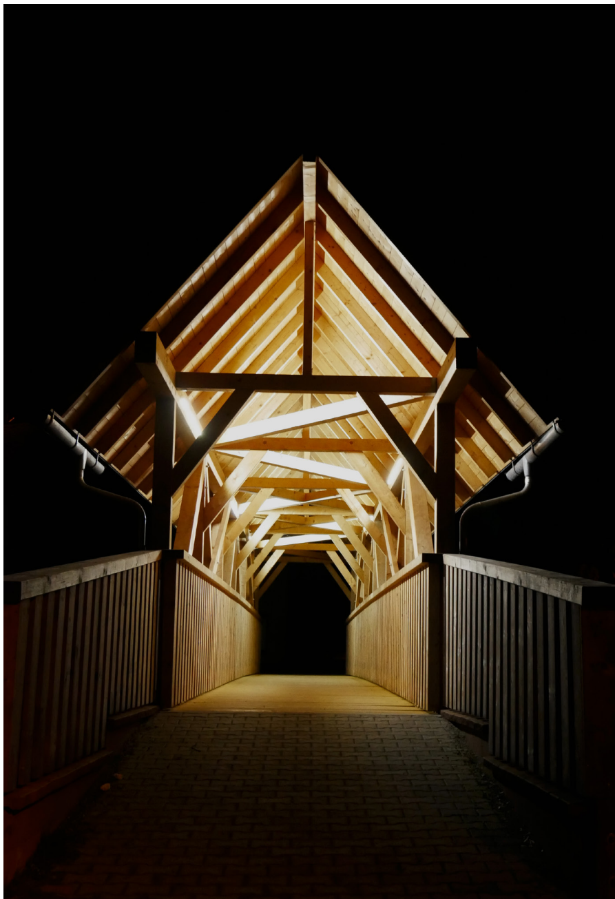
Dřevěná lávka přes Úpu Drewniana kładka na Úpie