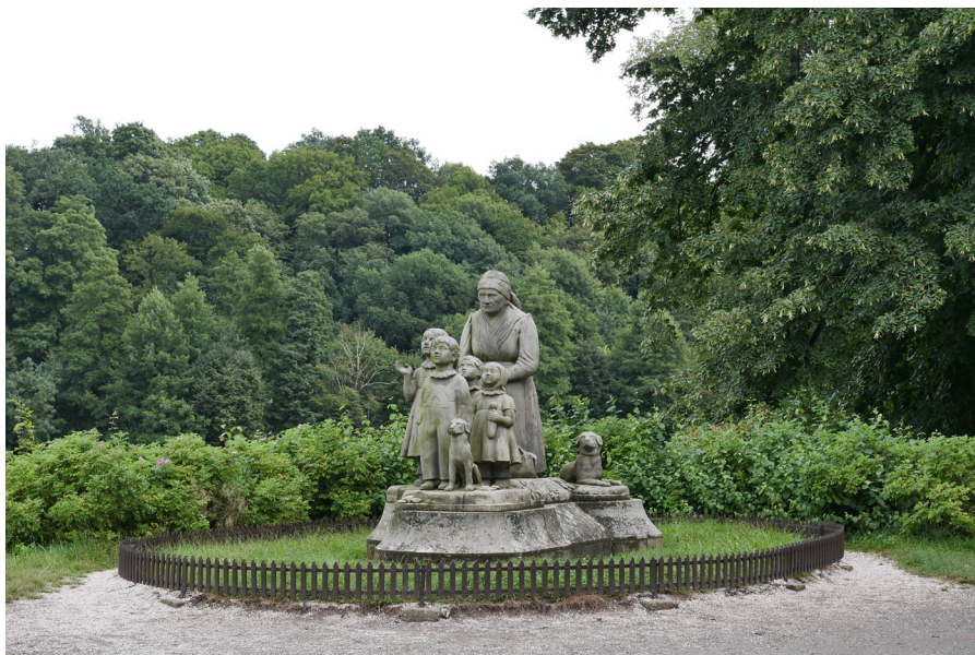
Pomník Babička s dětmi Pomnik Babuni z dziećmi