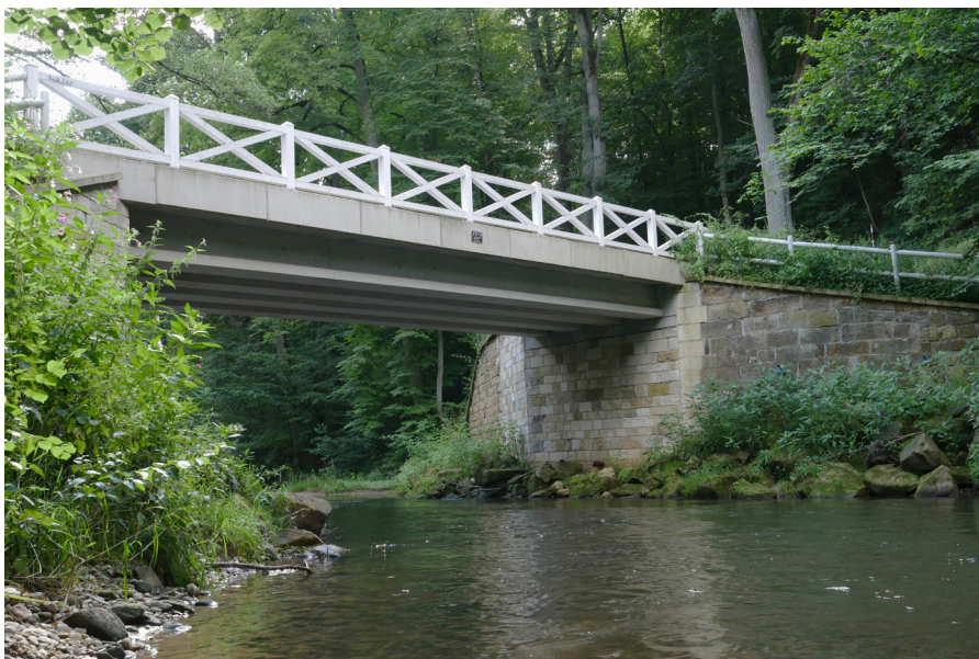
Bílý most Bialy most