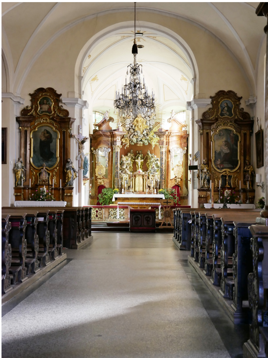
Kościół Nanebevzetí Panny Marie – interiér Kościół Wniebowzięcia Najświętszej Marii Panny – wnętrze