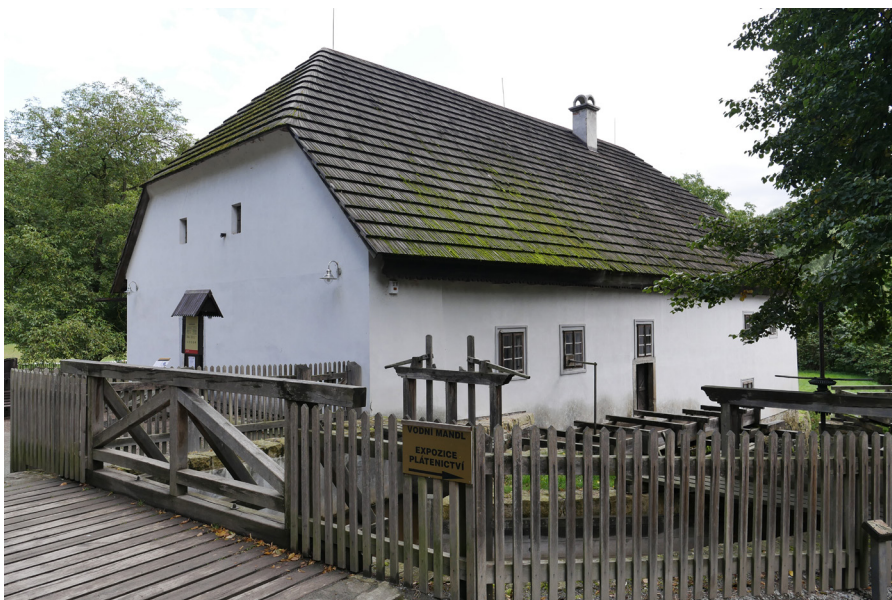
Rudrův mlýn Mlyn Rudra