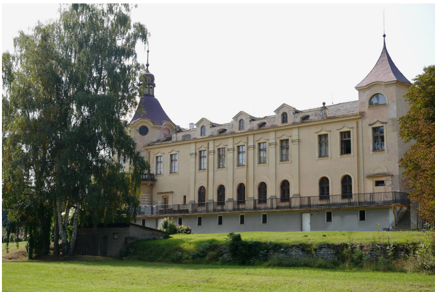
Muzeum Boženy Němcové z louky Muzeum Boženy Němcovej od strony ląki