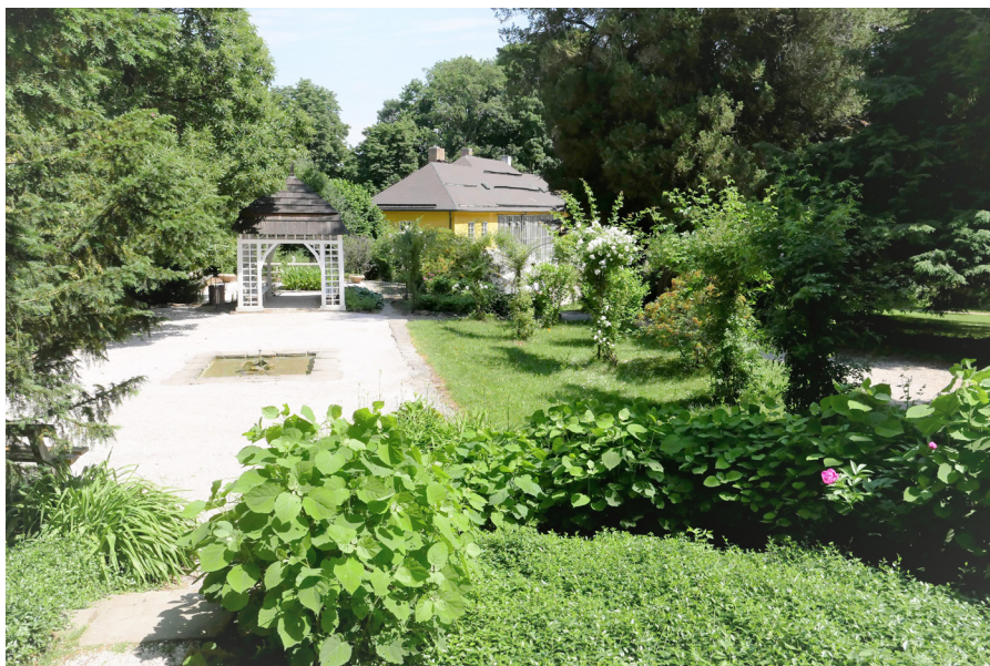
Altán na Růžovém paloučku Altana na růžanej lúčce