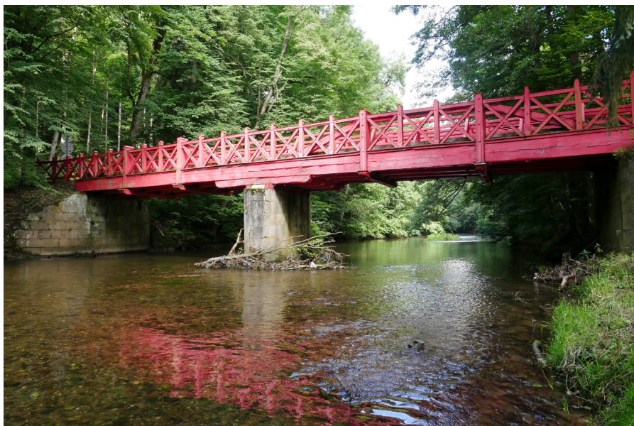
Červený most Czerwony most