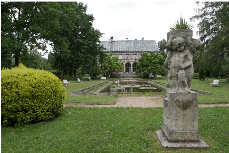
Vila Čerych Willa Čerych