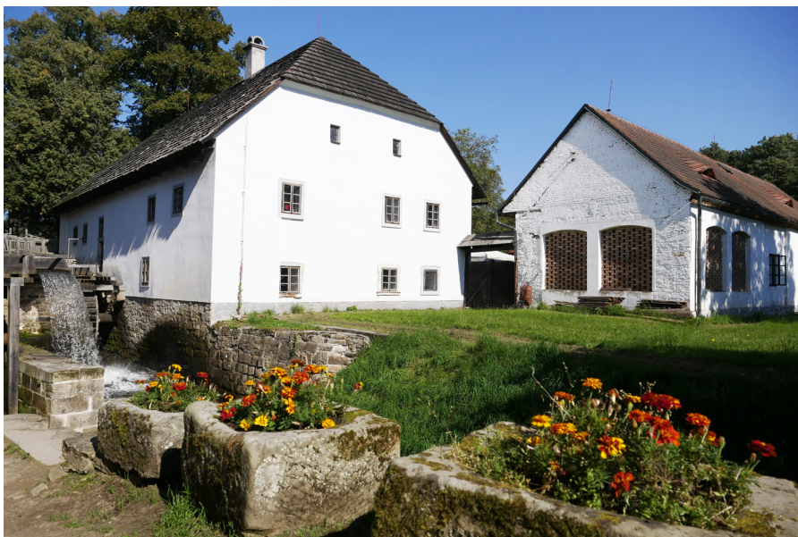
Rudrův mlýn Mlyn Rudra