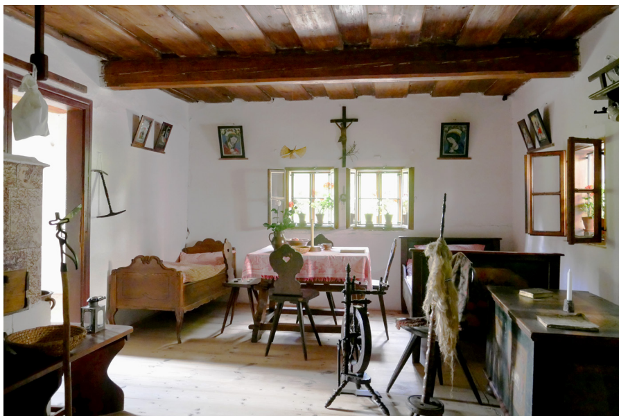
Staré bělidlo – interiér Stary bielnik – wnętrze