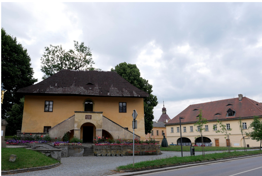
Stará fara v Malé Skalici Stara plebania w Malej Skalicy