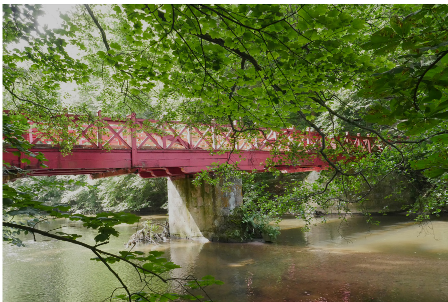
Červený most Czerwony most