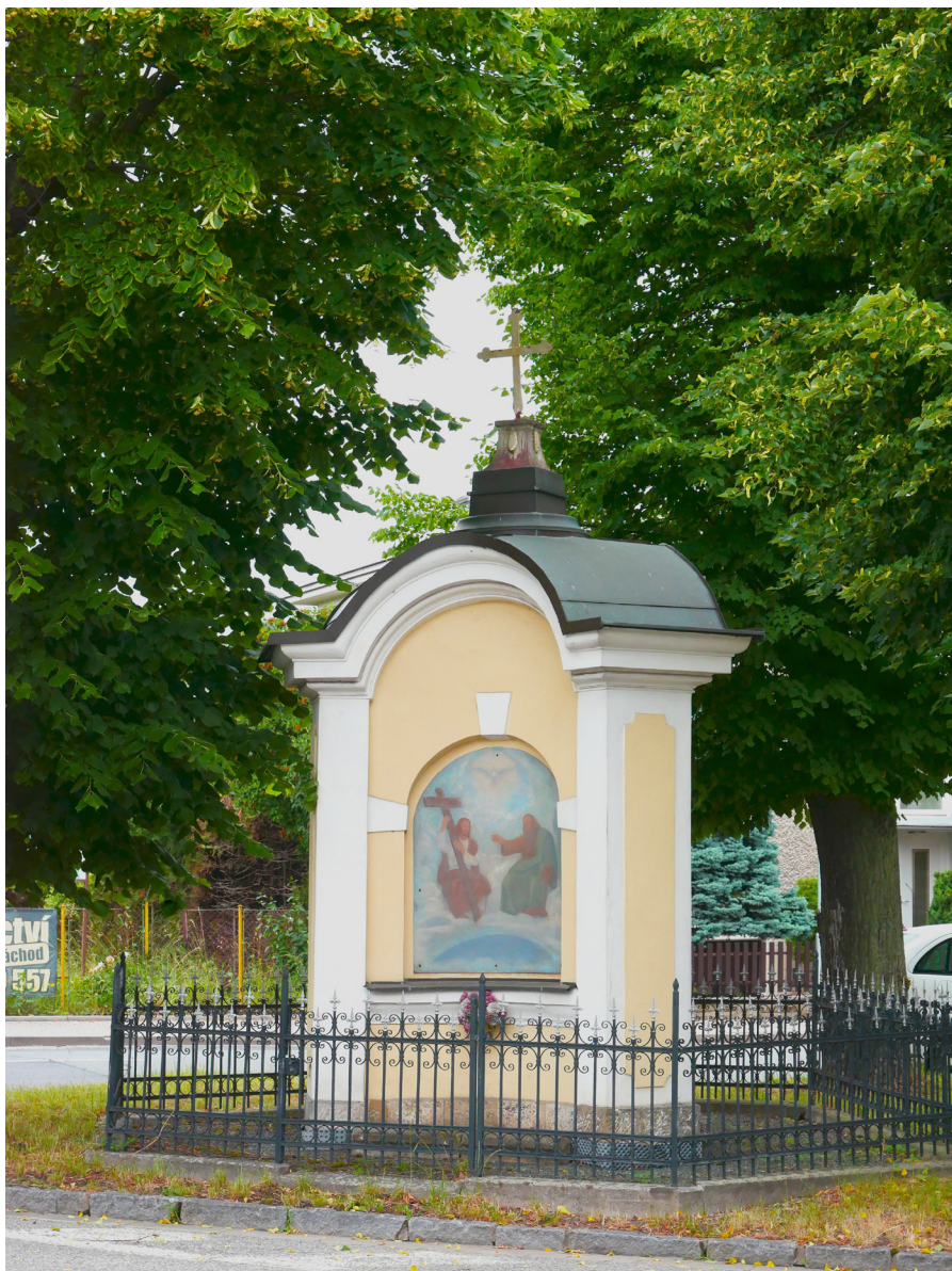
Kaple Nejsvětější Trojice Kaplica Trójcy Przenajświętszej