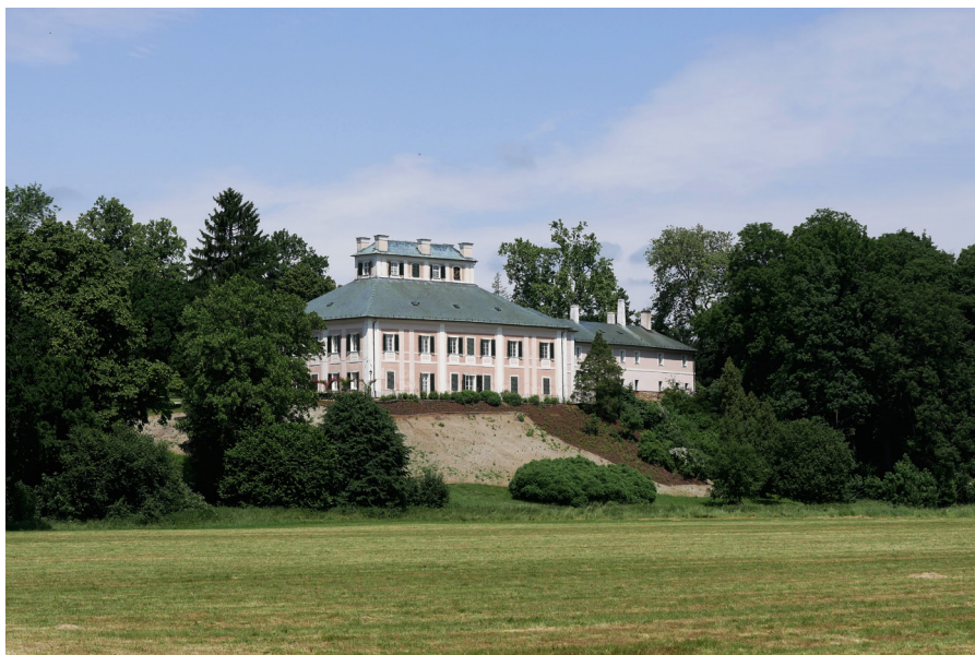
Zámek Ratibořice – pohled od řeky Palac Ratibořice – widok od strony rzeki