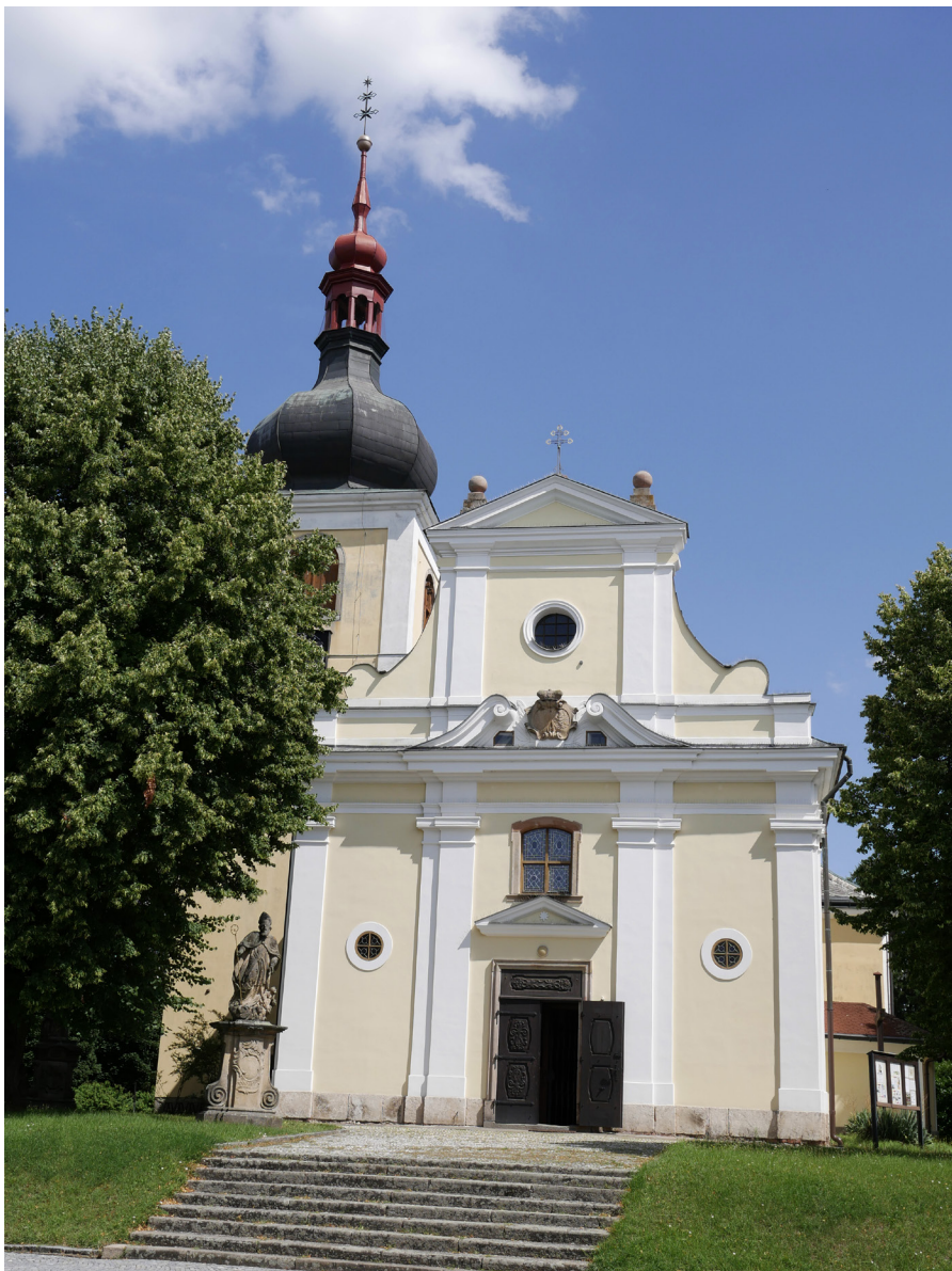
Kostel Nanebevzetí Panny Marie Kościół Wniebowzięcia Najświętszej Marii Panny