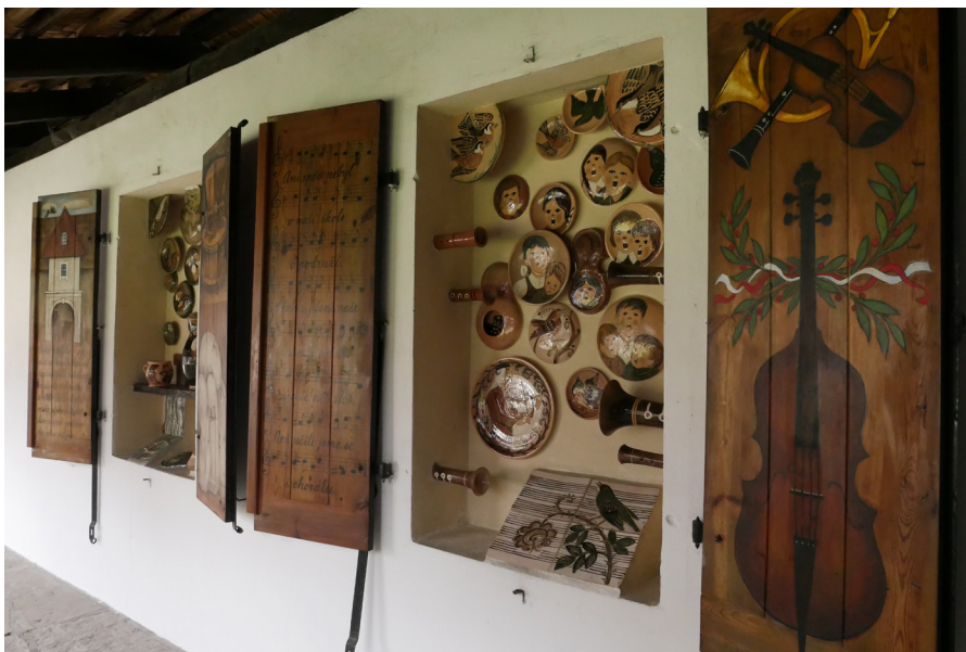
Barunčina škola – keramická výzdoba atria Szkola Barunki – dekoracje ceramiczne w atrium