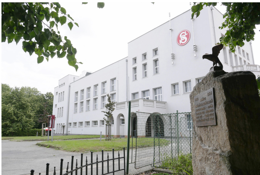
Sokolovna Siedziba Sokola