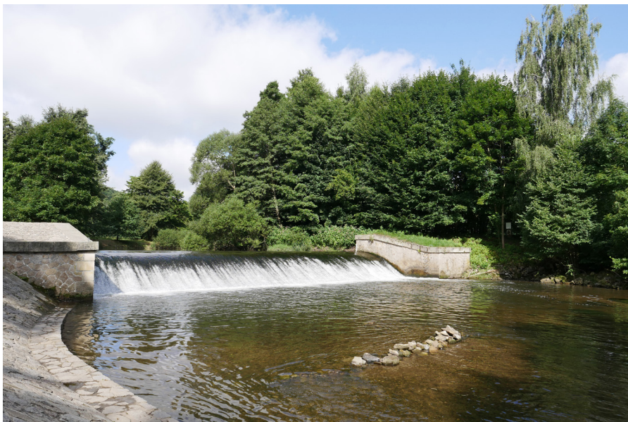
Viktorčín splav Jaz Viktorki, znany tež jako Jaz Wikty