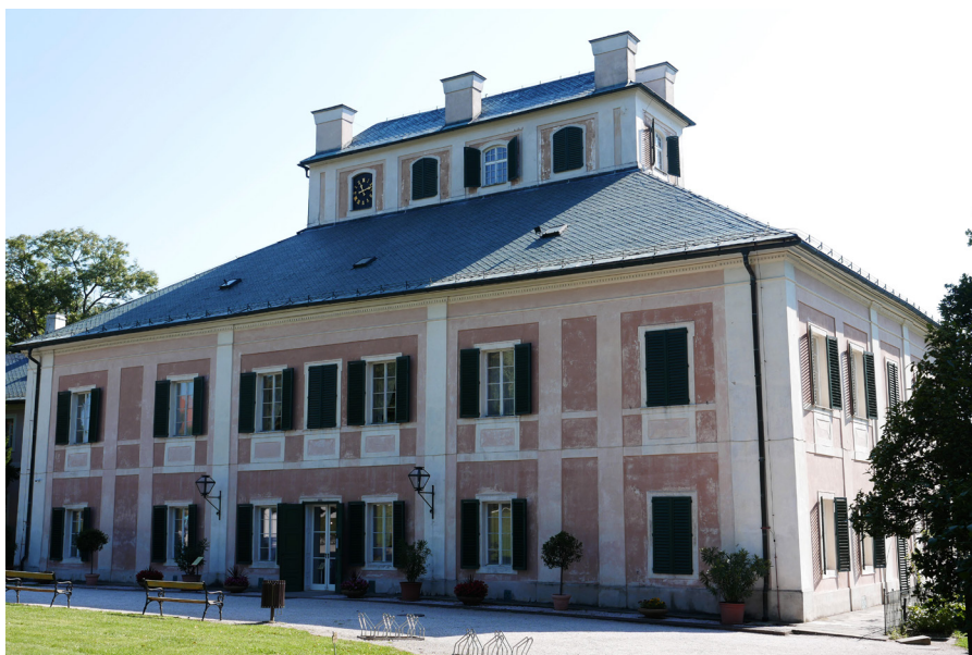
Zámek Ratibořice Palac Ratibořice