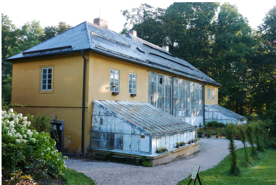
Zámecký skleník Szklarnia pałacowa