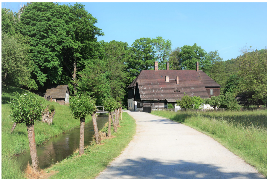
Cesta ke Starému bělidlu Droga w stronę Starego bielnika