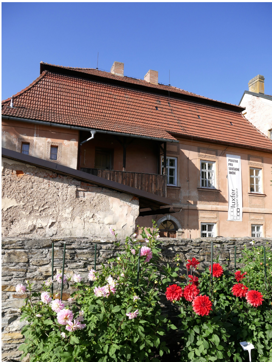
Galerie Luxfer ze dvora Galeria Luxfer od podwórza