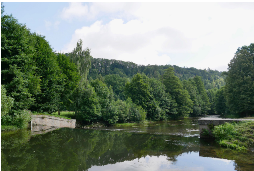
Viktorčín splav a okolní lesy Jaz Viktorki i okolícne lasy