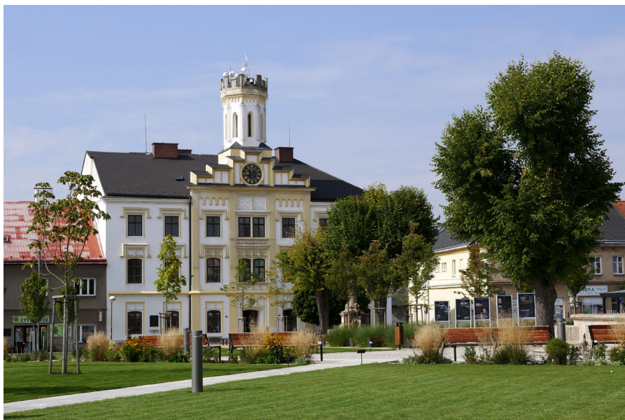
Stará radnice na Husově náměstí Stary ratusz na Placu Husa