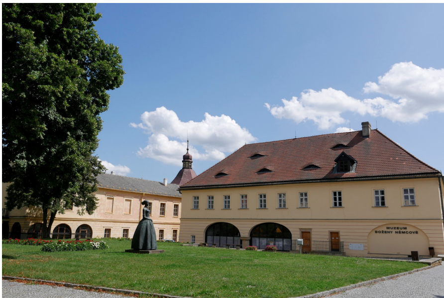
Muzeum Boženy Němcové se sochou Boženy Němcové Muzeum Boženy Němcovej z pomníkiem Boženy Němcovej