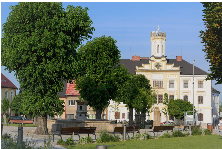
Stará radnice Stary ratusz