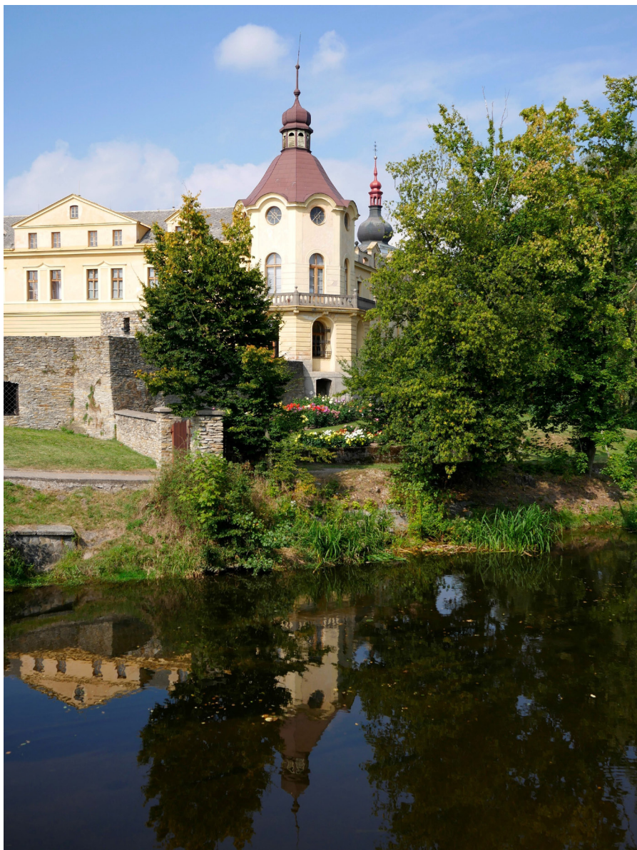
Muzeum Boženy Němcové s řekou Muzeum Boženy Němcovej z rzeką