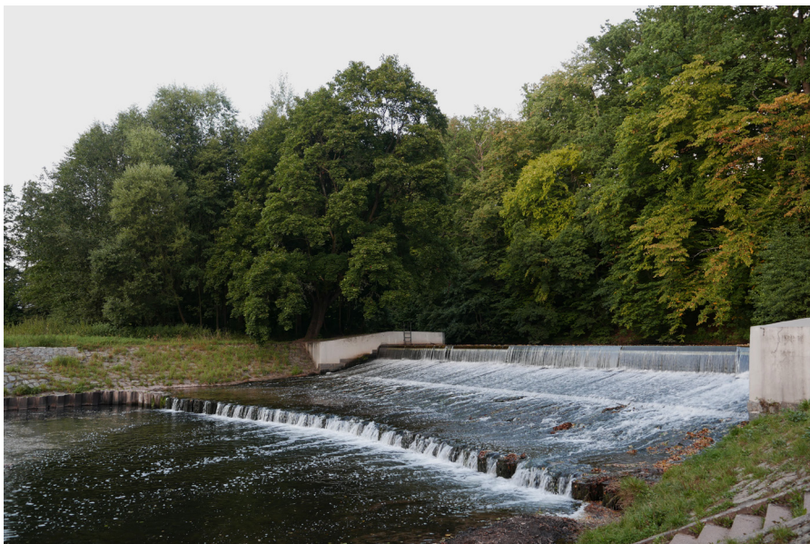
Řeka Úpa Rzeka Úpa