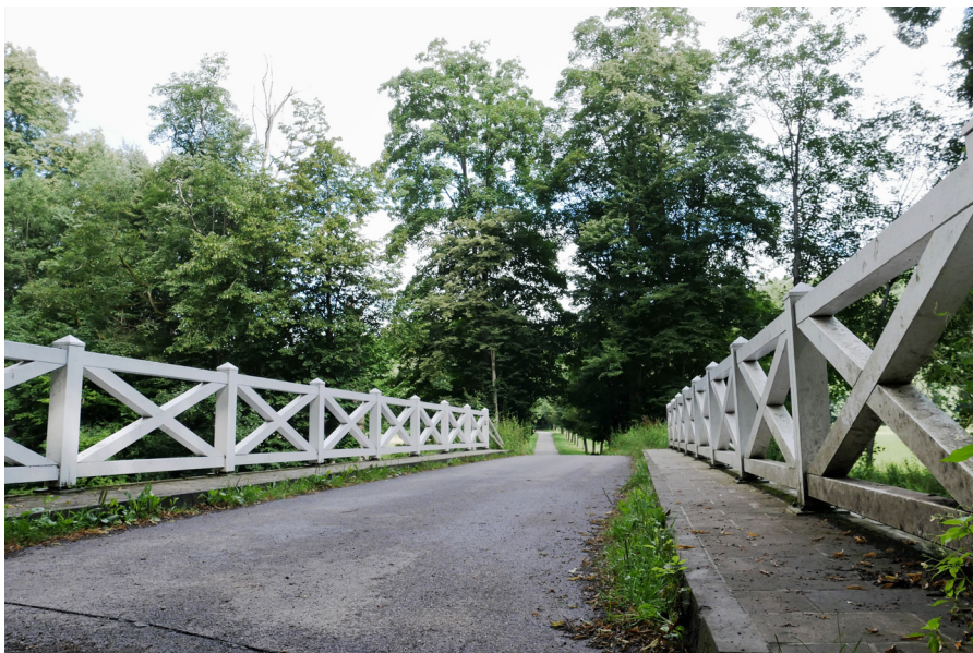
Bílý most Bialy most