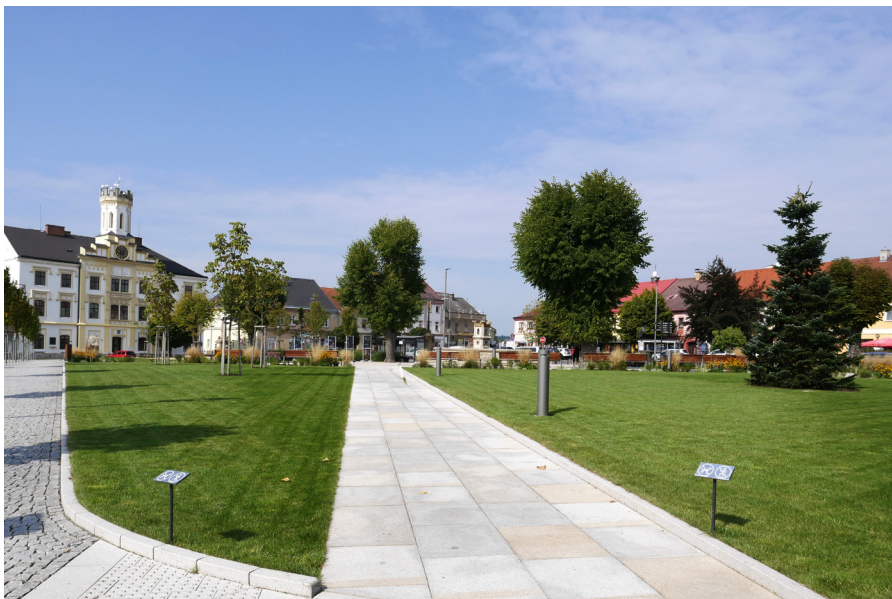
Husovo náměstí Plac Husa