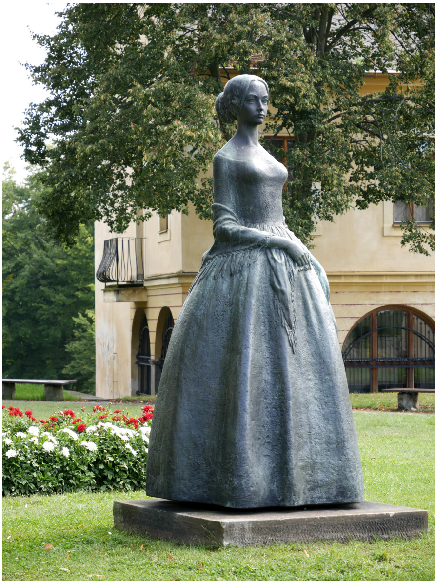
Socha Boženy Němcové Pomník Boženy Němcovej