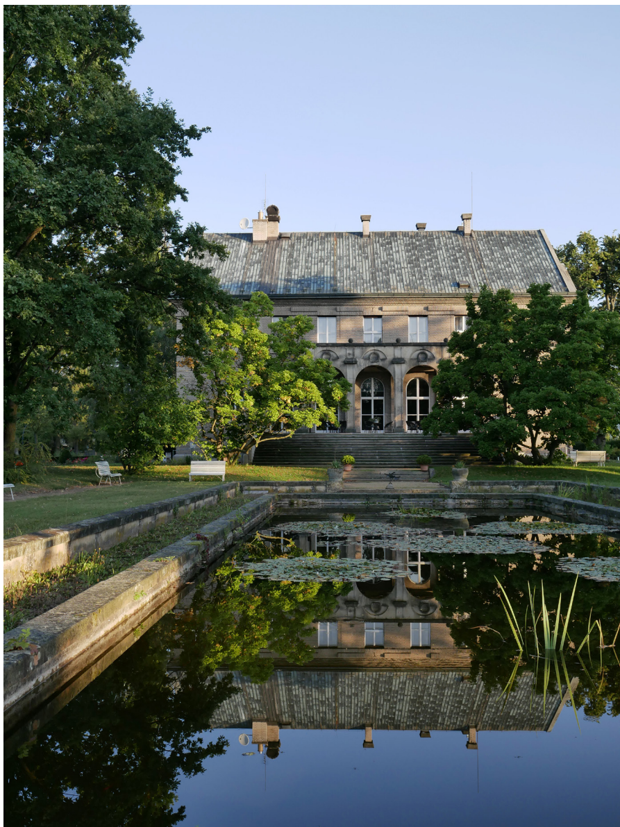
Vila Čerych Willia Čerych