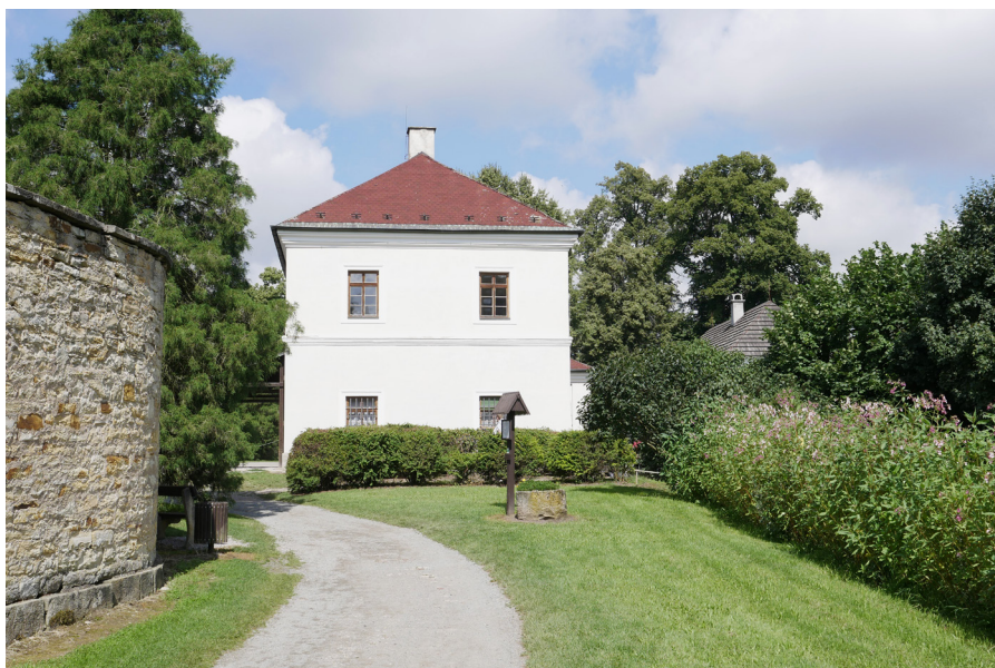
Cesta k Vodnímu mandlu Droga w stronę magla wodnego