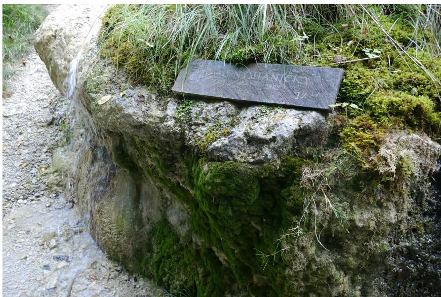
Pramen Hanička Žródlo Hanička