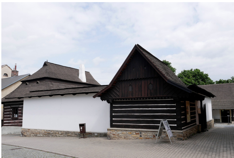
Barunčina škola Szkola Barunki