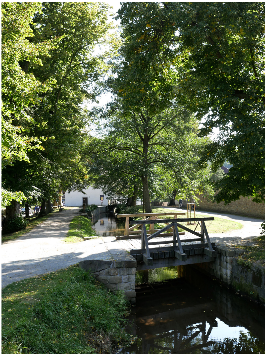
Cesta k mlýnu Droga w stronę młyna