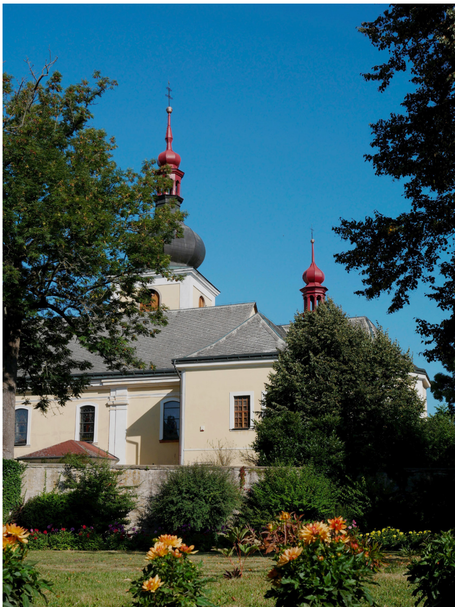
Kostel Nanebevzetí Panny Marie od Muzea Boženy Němcové Kościół Wniebowzięcia Najświętszej Marii Panny widziany od strony Muzeum Boženy Němcovej