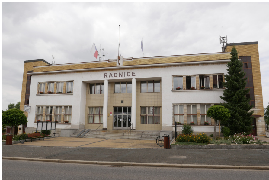
Městský úřad Urząd Miejski