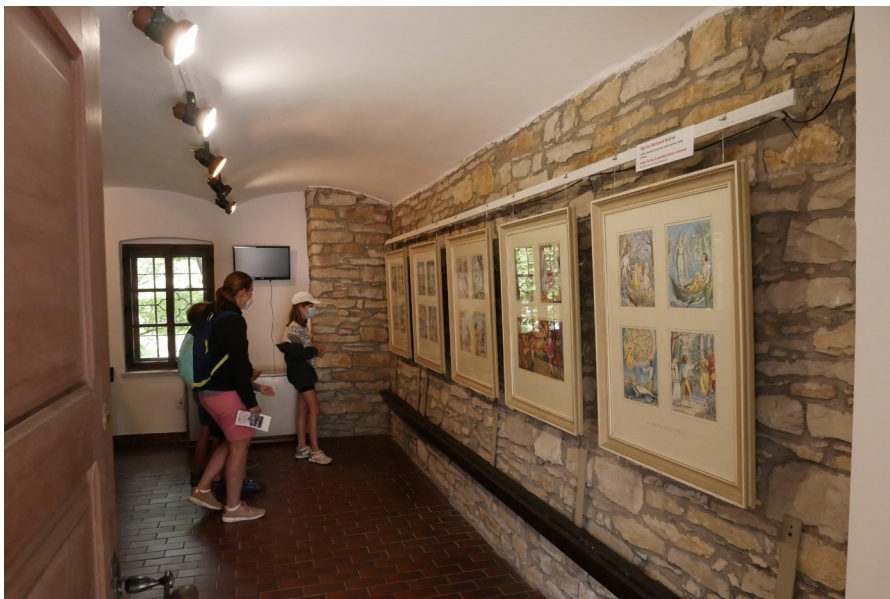
Barunčina škola – interiér Szkola Barunki – wnętrze