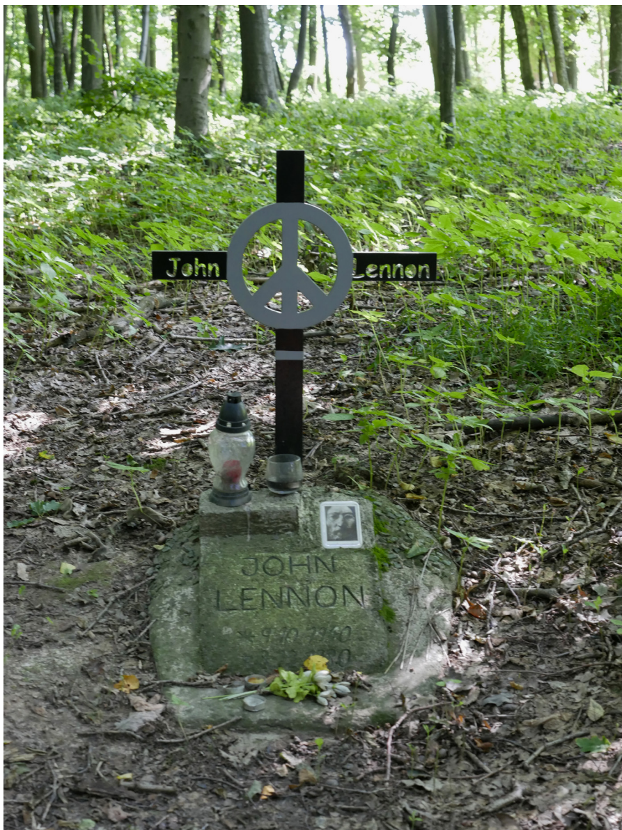
Pomník Johna Lennona Pomník Johna Lennona