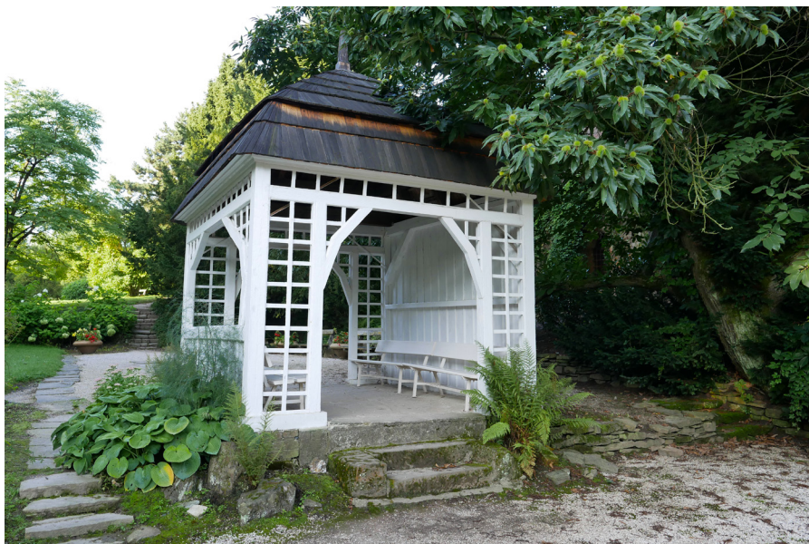
Altán na Růžovém paloučku Altana na růžanej lúčce