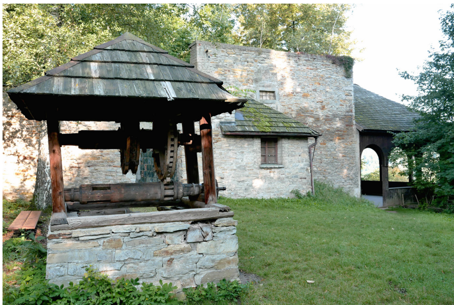
Rýzmburský altán Altana rýzmburska