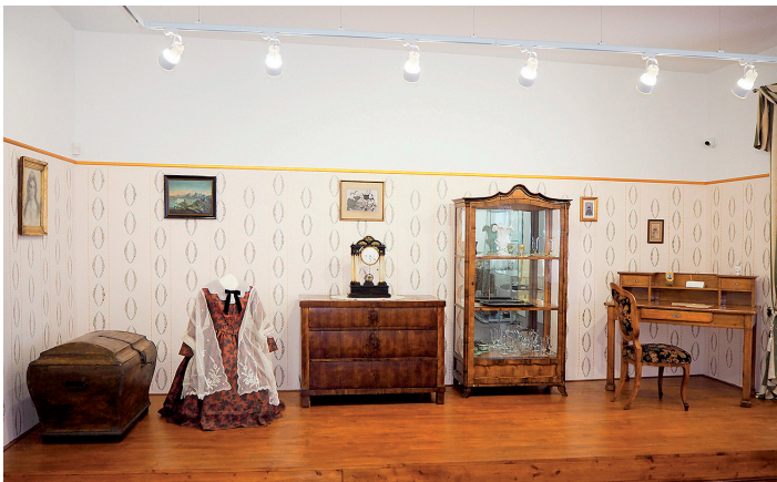
Ekspozycja zatytułowana Božena Němcová, diorama w stylu biedermeier

12 września 1837 r. w kościele Wniebowzięcia NMP, znajdującym się tuż obok gospody (gdzie następnie odbyła się uczta weselna), młodzianka Barunka Panklová wyszła za mąż za Josefa Němca, członka straży finansowej. Dwa dni po ślubie późniejsza pisarka została królową Balu Dalii (czes. Jiřinkový ples) podczas pierwszego patriotycznego Święta Dalii (czes. Jiřinkové slavnosti). Pisarka ponownie odwiedziła Święto Dalii w 1844 r., o czym