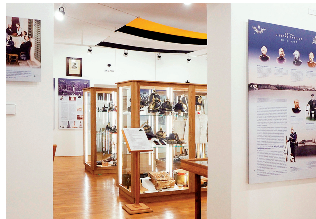
Ekspozycja pod tytułem Bitwa pod Česką Skalicą 28 czerwca 1866 r.

przypomina tablica pamiątkowa na budynku muzeum. Słynna Sala Dalii (czes. Jiřinkový sál) gościła także innych czeskich patriotów, takich jak Václav Kliment Klicpera i Bedřich Smetana, który był pod takim wrażeniem Święta Dalii, że w 1841 r. skomponował utwór pt. Jiřinková polka.